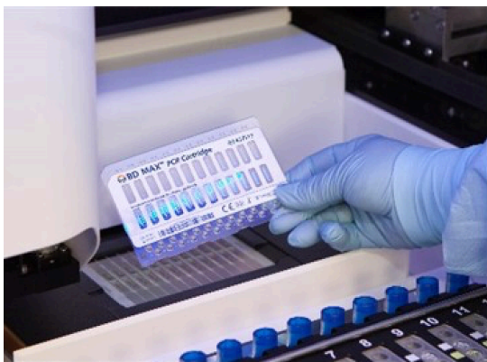
Figura 2: Carico delle cartucce BD MAX PCR