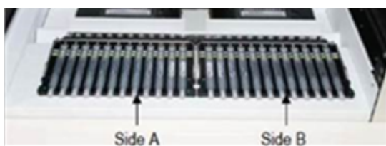
Figura 3: Carico del rack nel sistema BD MAX